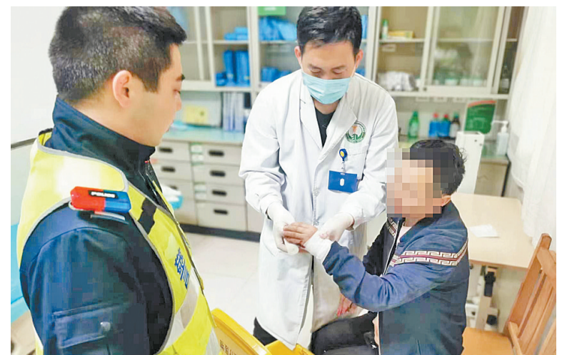
新乡县公安局民警争分夺秒,暖心护送断指伤者。

德民一边安排其他同事坚守岗位、疏导交通,一边驾驶警车护送伤者,同时将情况上报市交巡警支队指挥中心请求支援。指挥中心立刻对护送车辆将要经过的路段实施绿波管控。 从新乡县到救治医院原本需要30多分钟,但在指挥中心的帮助下,民警仅用了14分钟,就将伤者送到了医院,为断指续接手术争取了宝贵时间。 到医院后,民警快速将伤者送到急救中心(如图),直到伤者进了手术室,信德民和同事们悬着的心才落了下来。 目前,伤者已得到了有效救治,正在恢复中。伤者及家属对民警的热心救助表示衷心感谢。