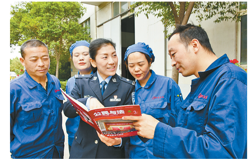
卫滨分局民警深入企业开展“送法进企业”活动,为企业提供“零距离”贴心法律服务。

为进一步深化“万警助万企”暨优化营商环境活动,5月6日,市公安局卫滨分局法制部门深入辖区对口企业开展“送法进企业”活动,为企业提供“零距离”贴心法律服务(如图)。 活动中,民警采取案例讲解、发放宣传资料等方式,与员工面对面交流,向员工提供法律咨询,号召大家自觉遵守国家法律法规,争做学法、守法、懂法、用法的好公民。 民警还深入车间了解企业经营现状,对企业经营中遇到的法律问题进行详细解答。同时,还认真排查企业安全管理漏洞,检查消防设施是否齐全、应急预案是否完善等,并对员工的消防器材使用技能进行现场培训,确保关键时刻拿得出、用得上,真正提升企业安全防范水平。 据了解,卫滨分局定期开展“送法进企业”活动,全面普及法律知识,有效帮助辖区企业养成知法、懂法、守法的良好习惯,增强了企业管理者和员工的学法热情,引导其运用法律武器维护自身合法权益,助力营商环境不断优化发展。