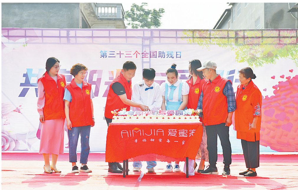
5月18日,卫辉市坚持落实“二马”机制,在第三十三次全国助残日即将到来之际,“共享阳光、与爱同行”助残日文艺汇演在卫辉市特殊教育学校举行。武术操、舞蹈、情景剧、诗朗诵,百余名师生载歌载舞共同庆祝第三十三次全国助残日。卫辉市星火爱心志愿服务队带着节日蛋糕,陪伴残障儿童一起度过了难忘而有意义的时光。

行动规划好、机制稳、举措全、力度大、氛围浓、效果好,经验和做法值得学习,希望高新区继续努力,着力打造乡村建设的“好样板”,树立乡村振兴的示范标杆。 高新区将以“三通一入地”工作为契机,抓手,因地制宜做好规划,一村一策分步实施,充分发挥城市近郊优势,围绕提升乡村基础设施建设及农村人居环境,打造休闲观光、乡村旅游等特色田园综合体,以完善的乡村建设和优美的田园风光带动农村地区经济发展,促进村美民富集体强。(高创)