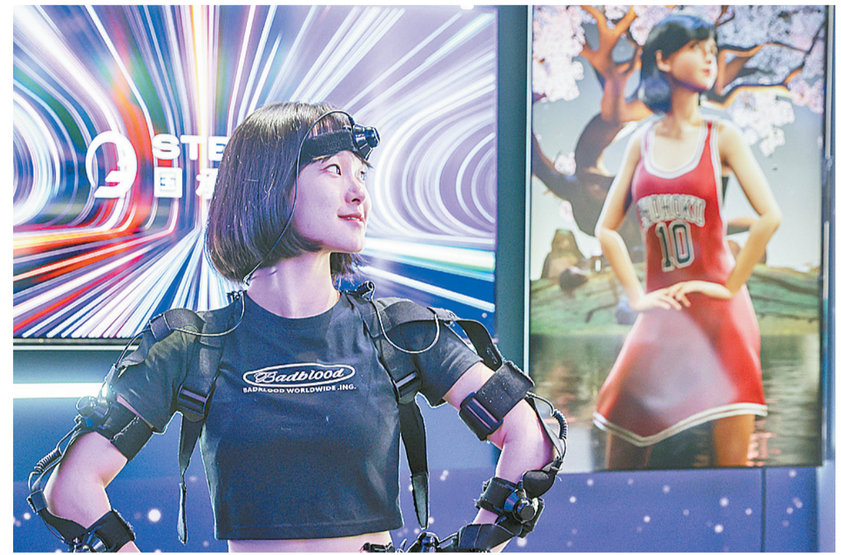
5月26日,模特在中关村国家自主创新示范区展示中心展示动作捕捉设备。2023中关村论坛于5月25日至5月30日在北京召开,中关村论坛展览(科博会)同期举行。展览集中展示前沿信息科技、元宇宙、绿色双碳、高端制造等前沿科技成果。