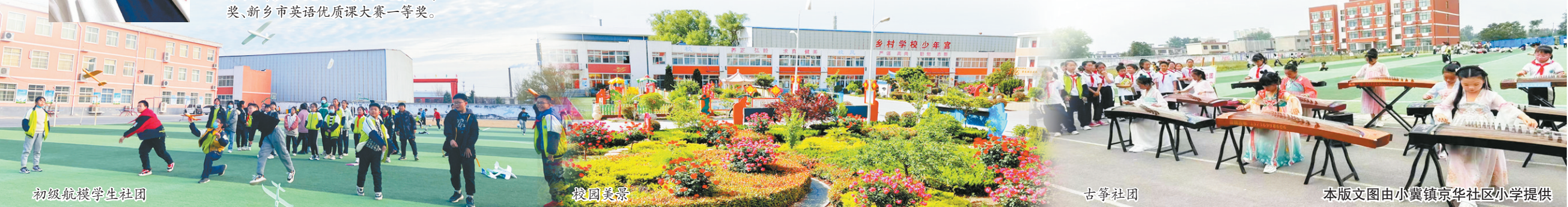
初级航模学生社团

乡市优秀学生社团，学校也被评为新乡市学生社团工作先进学校。奋楫正当时，风正好扬帆。在中国式教育现代化的新征程上，小冀镇京华社区小学将继续贯彻新发展理念，增强“四个意识”，坚定“四个自信”，做到“两个维护”，坚持守正创新，锚定奋斗目标，攻坚克难，埋头苦干，谱写新时代农村学校更加绚丽的华章。