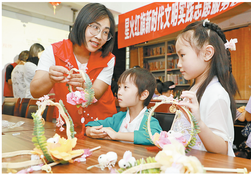
9月23日,曙光社区志愿者和孩子们一起制作手提月宫灯。当日,红旗区西街街道曙光社区文明实践站联合市工信局开展了“童心迎国庆 巧手绘中秋”传统文化进社区活动,让红色种子在孩子们的心中生根发芽。

节日期间,我市各大文博场馆也为市民及游客送上了一场场精彩的“文化大餐”。庆“双节”主题群众文艺系列展演、“丹青绘初心 奋进新征程”迎国庆书画作品、迎国庆诗词朗诵活动、“浓情中秋 喜迎国庆”手工制作月饼活动……以接地气的方式展示国家的发展巨变和伟大成就,用文艺演出、戏曲表演、交响音乐会、书画摄影作品等主题庆祝“双节”,让市民游客尽情享受假期生活乐趣,营造浓厚的节日氛围。