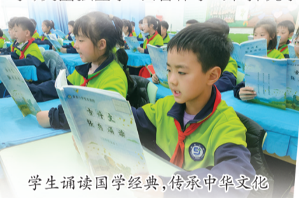
学生诵读国学经典,传承中华文化

根据“一线四学”的总体思想,针对各学科不同特点、不同学习内容,该校逐步梳理出各学科的学习模式。“立达”幸福课堂,锻炼了学生的社会化能力,提升了教育教学效果。