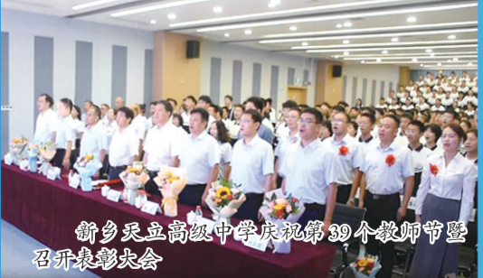
新乡天立高级中学庆祝第39个教师节暨召开表彰大会