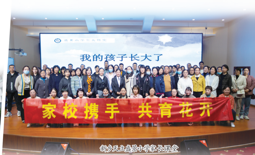
新乡天立盛景小学家长课堂

天立教育为孩子的健康快乐成长而生,实现孩子一生的幸福,是全体天立教育人不懈的追求。在“六立一达”育人目标的指引下,天之骄子正在成长为有能力开创自己幸福人生、造福社会的“大写的人”。站在新的历史起点上,坚定前行在为党育人、为国育才之路上的新乡天立盛景小学,将继续肩负起时代赋予的使命,聚势聚力汇聚各方力量,缔造卓越天立教育,成就师生幸福人生。