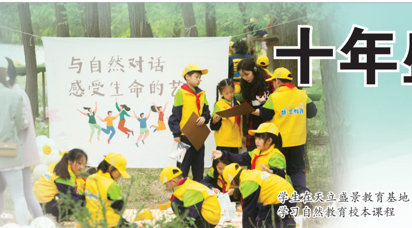
学生在天立盛景教育基地学习自然教育校本课程