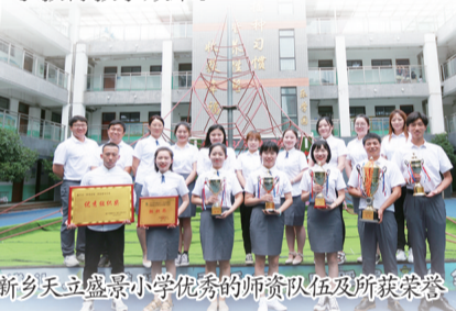
新乡天立盛景小学优秀的师资队伍及所获荣誉