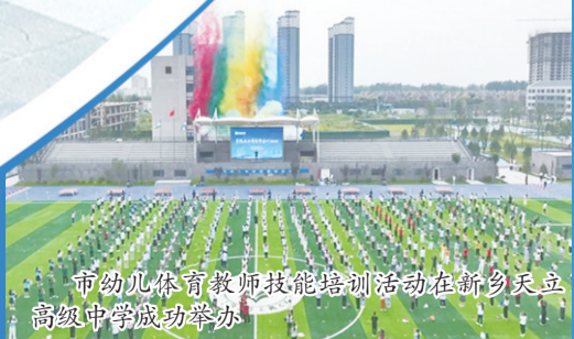
市幼儿体育教师技能培训活动在新乡天立高级中学成功举办

清北名师(所教学生有50多人考入清华大学、北京大学、香港大学、曼彻斯特大学、新南威尔士大学、上海交通大学等QS前50名校,培养“双一流”名校学生600余人)。皖西好老师,六安市骨干教师,六安市模范教师,六安市优秀班主任,六安市联考物理命题组组长,安徽省培优联盟命题专家,安徽省中小学教师资格考试面试考官,国家级课题研究负责人,一个国家级、3个省级课题负责人。他先后在北京大学、复旦大学进修,多次到中国香港、日本、新加坡等地进行教育考察。由于教育教学成果卓越,多次被中央电视台、《人民日报》《中国青年报》《南方日报》、新华网、人民网、澎湃新闻、腾讯网、《人物》杂志等多家媒体报道。