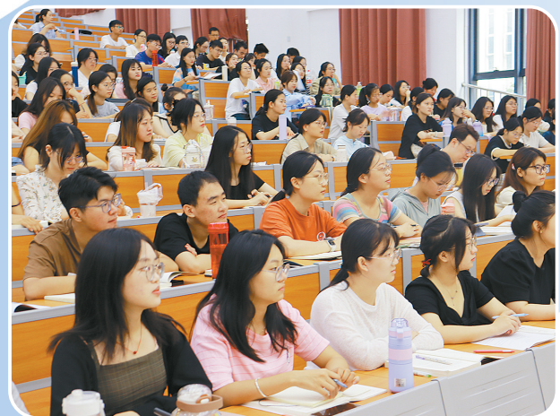
▲ 学子学习积极性高涨,课堂氛围浓厚