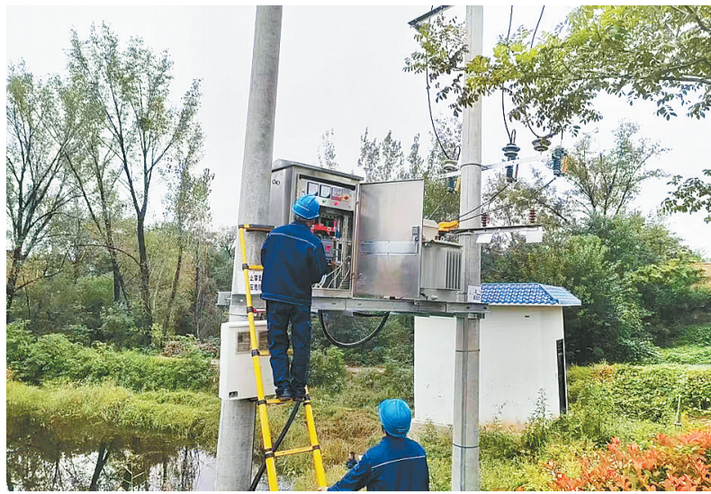
汛”特殊时段用电安全可靠供应。

下一步,该公司将持续深入开展排灌设施安全用电隐患排查工作,密切关注天气变化,以良好的设备状态、充足的应急人员、物资,全力保证“秋收+秋