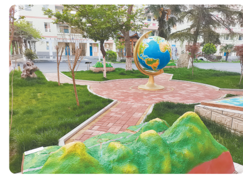
优美独特的地理园一角

“勤实精进”薪火传，四中精神谱华章。新乡市第四中学(以下简称新乡四中)创建于1943年，前身是“三育中学”“河朔中学”，悠久的历史赋予她深厚的文化底蕴，优越的位置又使她感受着时代的活力。80年的风雨兼程，披荆斩棘，一代又一代的四中人在这里见证着学校的沧桑巨变。全体四中人不忘初心、守正创新、牢记使命、砥砺前行，积淀形成了独具特色的以“河朔魂”为精神核心的校园文化，“勤实精进”分别代表这些年全体四中人二次创业过程中积淀下来的宝贵精神财富和优良作风，学校管理者勤政、务实、精细、进取，学校教职员工勤勉、踏实、精湛、奋进，学生勤奋、朴实、精彩、进步。 笃信精勤拓新路，笃行致远结硕果。新乡四中坚持社会主义办学方向，以立德树人为根本任务，以理想信念教育为核心，以培育和践行社会主义核心价值观为主线，以建立完善全员、全程、全方位育人体系为关键，打破常规、锐意改革，走出了一条自强、合作、创新、发展的崛起之路。学校发生了颠覆性的变化，在校生人数由2014年9月份的22个教学班814人增加到目前的30个教学班1695人，学生人数增长了一倍。丹心育人无声，培育硕果累累，各省级示范性高中过线人数均创历史新高，社会声誉不断提高，形成了独具特色的“四中实践”，取得了丰硕成果。近3年，新乡四中获得省、市级荣誉58项，受到了社会各界的高度赞扬，被誉为新乡人才培养的摇篮、基础教育和文化引领的高地。