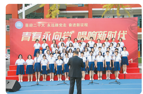
唱响新时代汇演现场