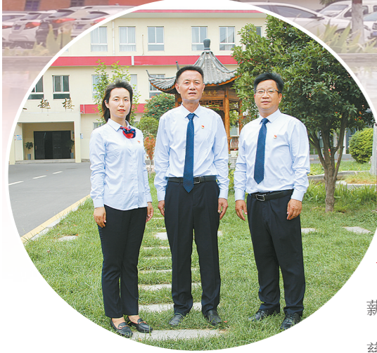
勤政、务实、精细、进取的校领导班子