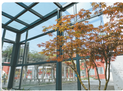
生机勃勃的阳光房