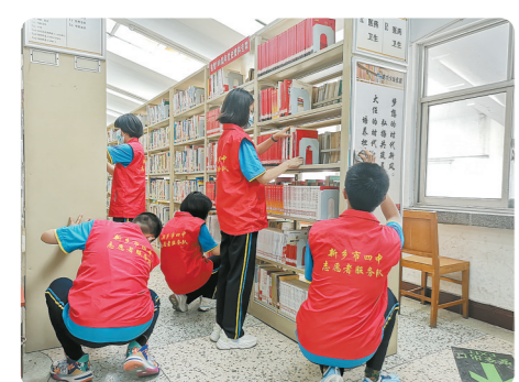
朔悦志愿服务队开展志愿服务活动现场