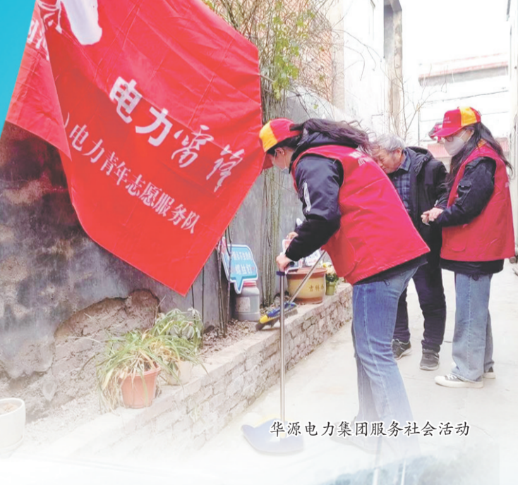
华源电力集团服务社会活动