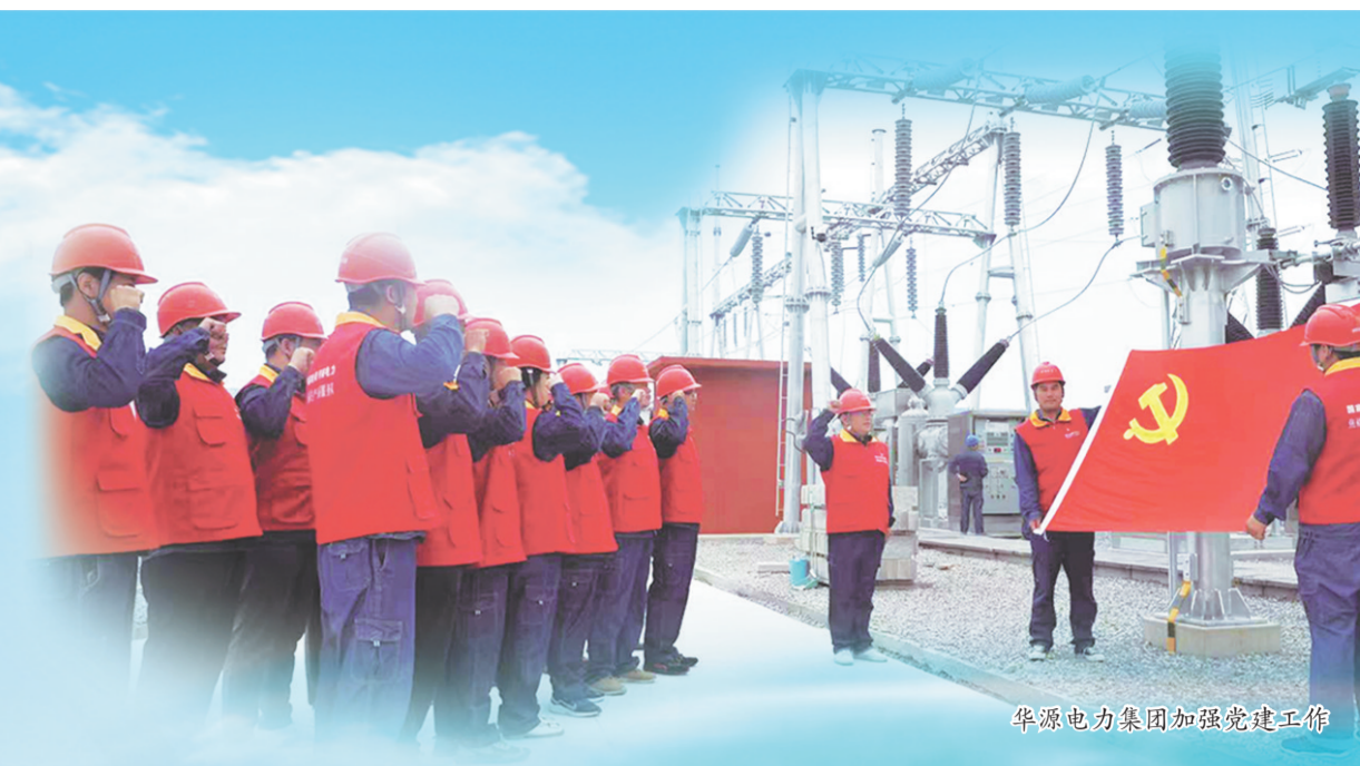
华源电力集团加强党建工作

新乡华源电力集团有限公司(以下简称华源电力集团)自成立以来,以新乡市场为大本营,奋力开拓国内市场,工程遍布省内外,取得了一个个耀眼的成绩,展现出“大鹏一日同风起,扶摇直上九万里”的气概。能够取得这样的成绩,得益于华源电力集团对党的方针政策的学习、领悟和运用,得益于对基层党组织的指导,得益于对职工的关爱。正是有了这些综合因素,才造就了今日的辉煌。