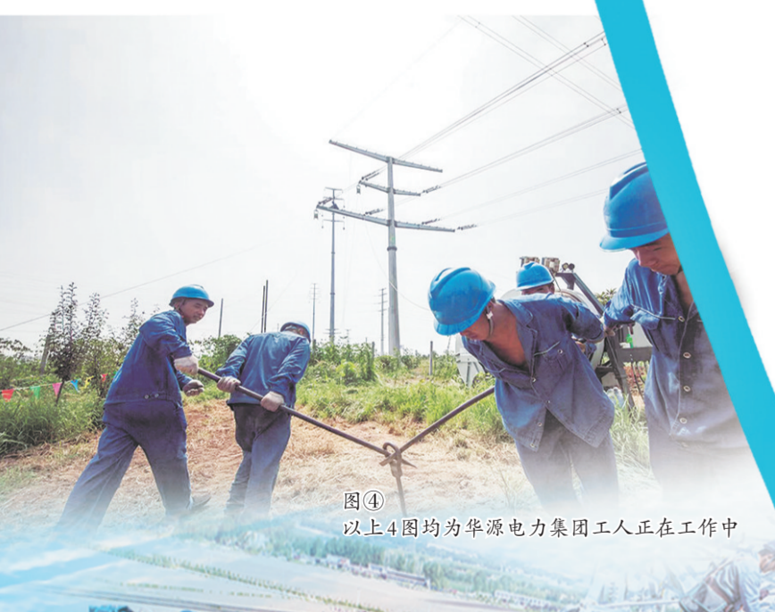
图④ 以上4图均为华源电力集团工人正在工作中