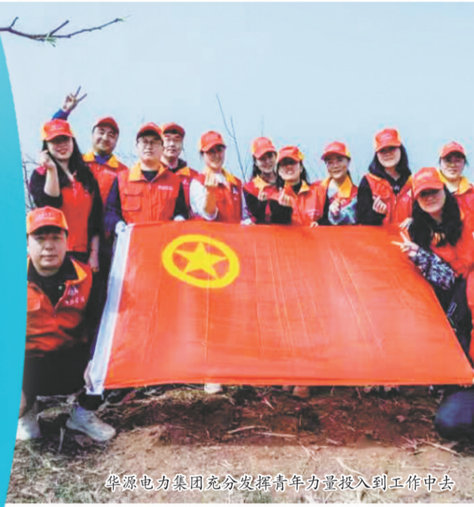
华源电力集团鼓励鼓励青年力量投入到工作中去