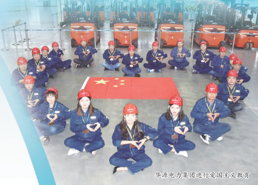
华源电力集团进行爱国主义教育