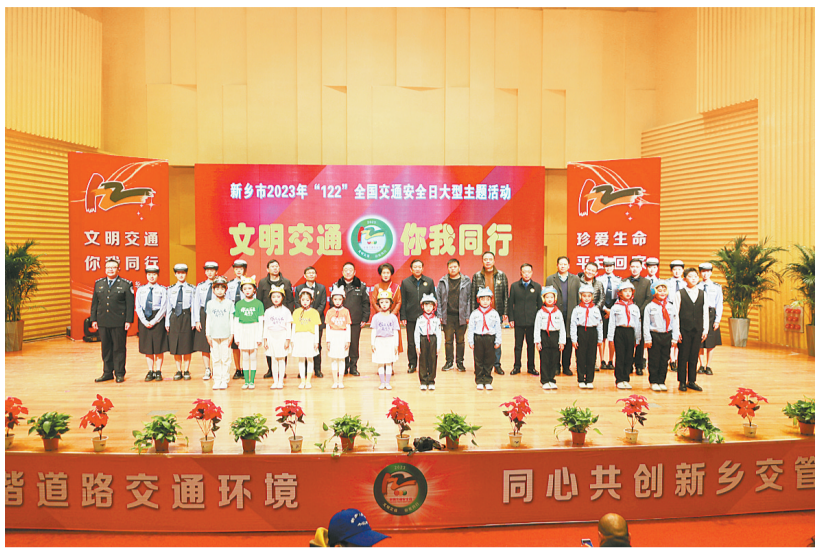
小朋友们纷纷举手参与抢答。他们分别获赠精美的卡通小熊和安全头盔。安全是生命之本。在此次全国交通安全日

活动现场设置装备展示区、互动体验区、警保联动区、交通安全模拟展台等,犹如琳琅满目的交通安全大集市,让人目不暇接。现场每个活动区域都挤满了小记者,特别是在交警装备展示区、交通安全模拟展台前,许多人排队参加体验活动,现场洋溢着浓厚的交通安全氛围。在平原文化艺术中心音乐厅,观众正在观看新乡交警制作的《关爱生命 平安出行》交通安全警示教育片。