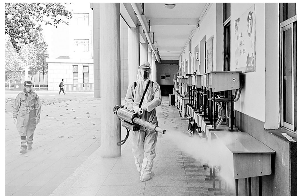
近日,市第一中学邀请牧野区消防应急救援中心出动7名队员,对校区进行环境消杀,预防甲型流感病毒,保障校园师生健康安全。

珍惜土地人人有责,保护耕地利国利民。新乡经开区自然资源和规划局将牢固树立长期作战思想,常抓不懈,做到发现一起、查处一起、打击一起,始终保持严厉打击非法挖沙取土行为的常态化高压态势,确保非法挖沙取土行为得到有效遏制。