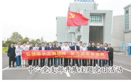
中心党支部开展主题党日活动

2023年,在市委、市政府的坚强领导下,在省南水北调中心、市水利局的关心支持下,市南水北调工程运行保障中心坚持以习近平总书记“节水优先、空间均衡、系统治理、两手发力”治水思路为指导,扎实开展学习贯彻习近平新时代中国特色社会主义思想主题教育,以在建项目快速推进为抓手,以运行管理“三化”建设为驱动,守正创新,踔厉奋发,取得了喜人的成绩,谱写了南水北调后续工程高质量发展的新篇章。