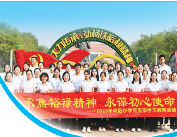
向阳小学主题教育活动