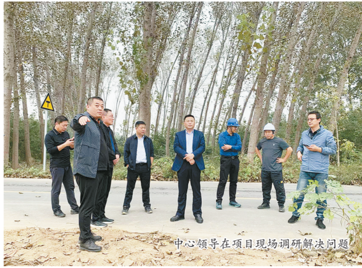
中心领导在项目现场调研解决问题

文化建设培根铸魂。该中心牢固树立“实在实干实绩”的工作导向,持续开展作风纪律大提升活动,转作风,树新风,营造积极向上的干事创业氛围。坚持大抓基层鲜明导向,大兴调查研究之风,落实领导干部“四下基层”制度,切实解决一线干部职工工作中遇到的问题。在全省南水北调系统率先试点打造红色管理站所,精心设计管理站所党建文化墙,以配套工程凤泉管理站为试点,以“党建+”“机关+站所”模式引领运营工作高质量发展。组织开展年度优秀评选表彰大会,搭建亮绩、赛绩擂台,评比先进个人、先进科室,形成争先进位、比拼赶超的“内动力”。积极举办第三届“丹江杯”篮球赛,组织参加拔河比赛、乒乓球赛、健步走等各类文体活动,增强干部职工大局观念和集体荣誉感,塑造团结协作、奋勇争先的文化底色。