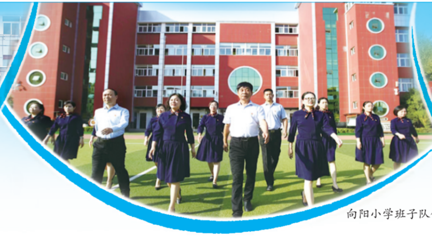
向阳小学班子队伍