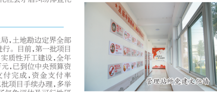
管理站所党建文化墙

协调推动配套水厂规划建设。南水北调配套工程好似城市供水“大动脉”,丹江水润泽全城还要靠“毛细血管”——城市供水管网,如何将城市供水“大动脉”与“毛细血管”及时连接,配套水厂建设工作就格外重要。为实现南水北调配套工程与配套水厂工程同步通水、同步达效的目标,市南水北调中心高度重视配套水厂建设,积极与各县(市、区)对接,推动配套水厂高标准建设,倒排工期、加快进度。其中,南线项目两座配套水厂