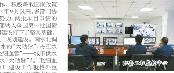
配套工程监控中心

与南水北调配套工程同步建成,如期通水;东线项目共设计水厂4座,2座正在建设,2座正在加紧办理前期手续,力争与东线项目同步建设、同步达效。