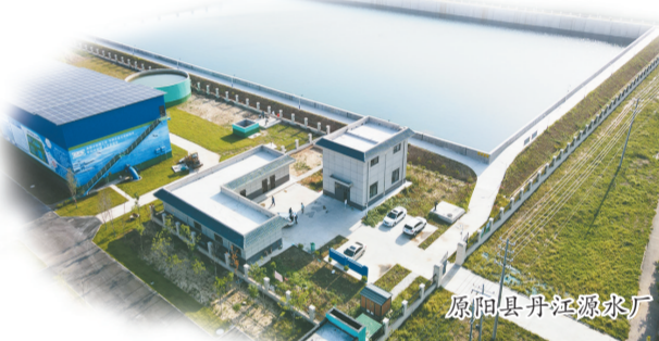
原阳县丹江供水厂

2023年,在市委、市政府的坚强领导下,在省南水北调中心、市水利局的关心支持下,市南水北调工程运行保障中心坚持以习近平总书记“节水优先、空间均衡、系统治理、两手发力”治水思路为指导,扎实开展学习贯彻习近平新时代中国特色社会主义思想主题教育,以在建项目快速推进为抓手,以运行管理“三化”建设为驱动,守正创新,踔厉奋发,取得了喜人的成绩,谱写了南水北调后续工程高质量发展的新篇章。