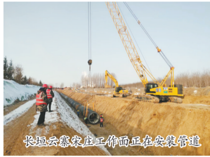
长垣云寨寨庄工作面正在安装管道