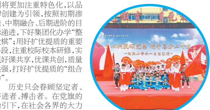
向阳小学新队员入队仪式

“智+”赋能,向“智慧型”教师迈进。学校积极推进课题研究。每个教研组把问题当课题,以科研促教研,每学期开展一项小课题研究。采取“网络+教研”,引导各学科教师全员参与、全程卷入、全方位辐射,把信息技术与学科教学深度融合。从课题、信息技术运用上发力,助力教师向“智慧型”教师迈进。