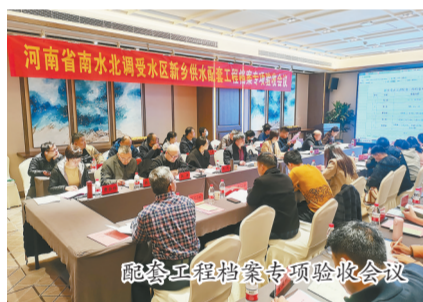
配套工程档案专项验收会议