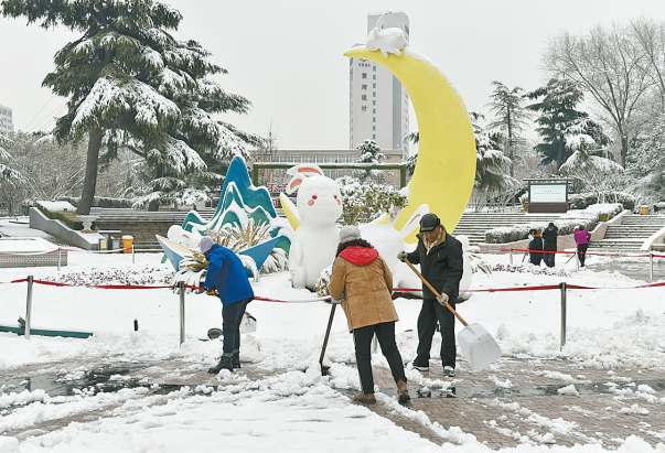
1月16日,工作人员在郑州市紫荆山公园清理积雪。1月15日,受冷空气影响,河南省部分地区迎来降雪。