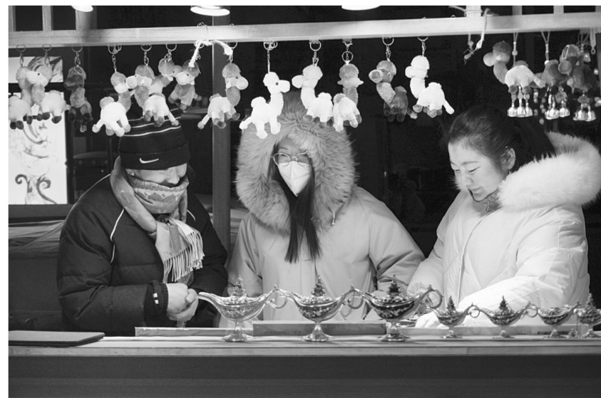
1月21日,在甘肃省敦煌市的敦煌夜市,游客选购纪念品。冬季,甘肃省敦煌市各景区旅游市场“升温”,不少游客来此进行研学游、冬季游等活动。据敦煌市文旅部门统计,今年1月1日至1月20日,敦煌市六大景区累计接待46874人次,相比2023年增长128.32%。

市场监管总局食品审评中心统计显示,截至2023年11月底,我国具有国家标准的补充营养素类产品已基本纳入备案管理,有1500余家企业获得保健食品备案登录账号,获得保健食品备案凭证的产品17000余个,其中功能类产品3300余个,满足了消费者对维生素C、辅酶Q10类产品的需求,为消费者带来了更多质高价优的保健食品。