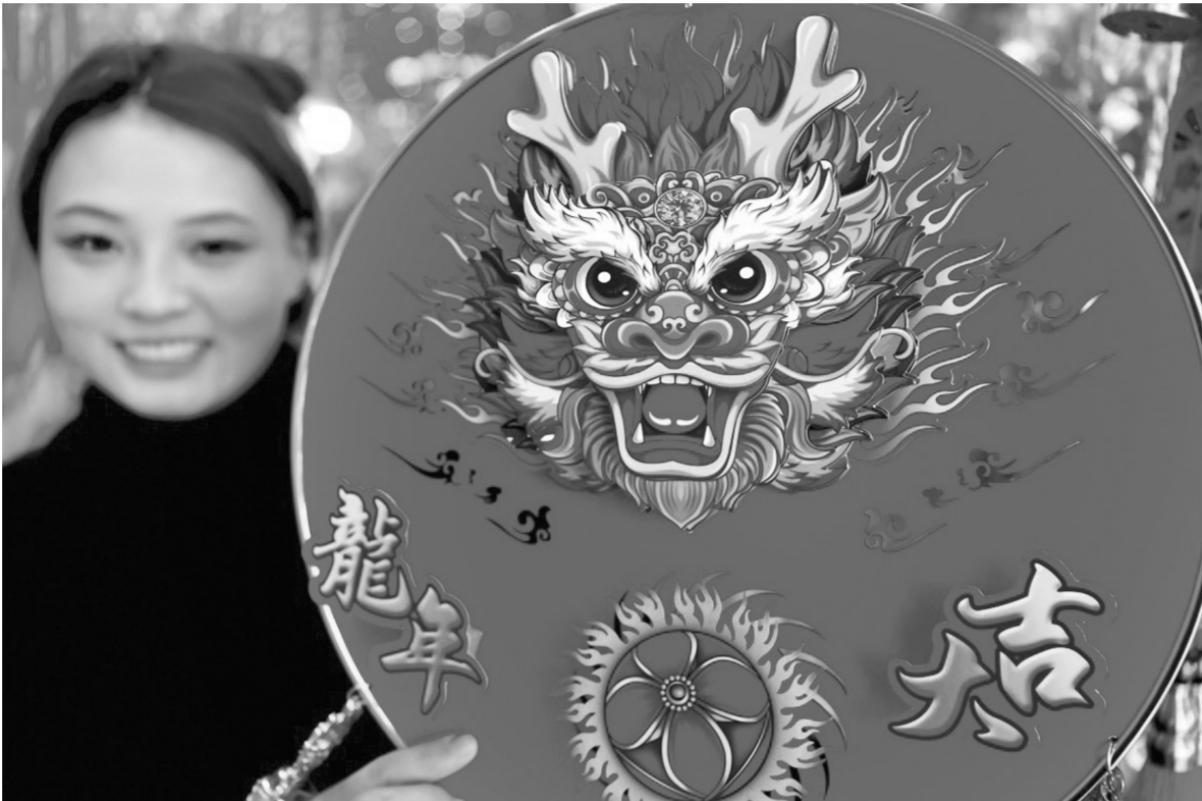
1月22日,市民在安徽省亳州市谯城区蒙城路年货市场展示选购的春节饰品。春节临近,各地张灯结彩。人们逛花市、赏花灯、置办年货,年味渐浓。