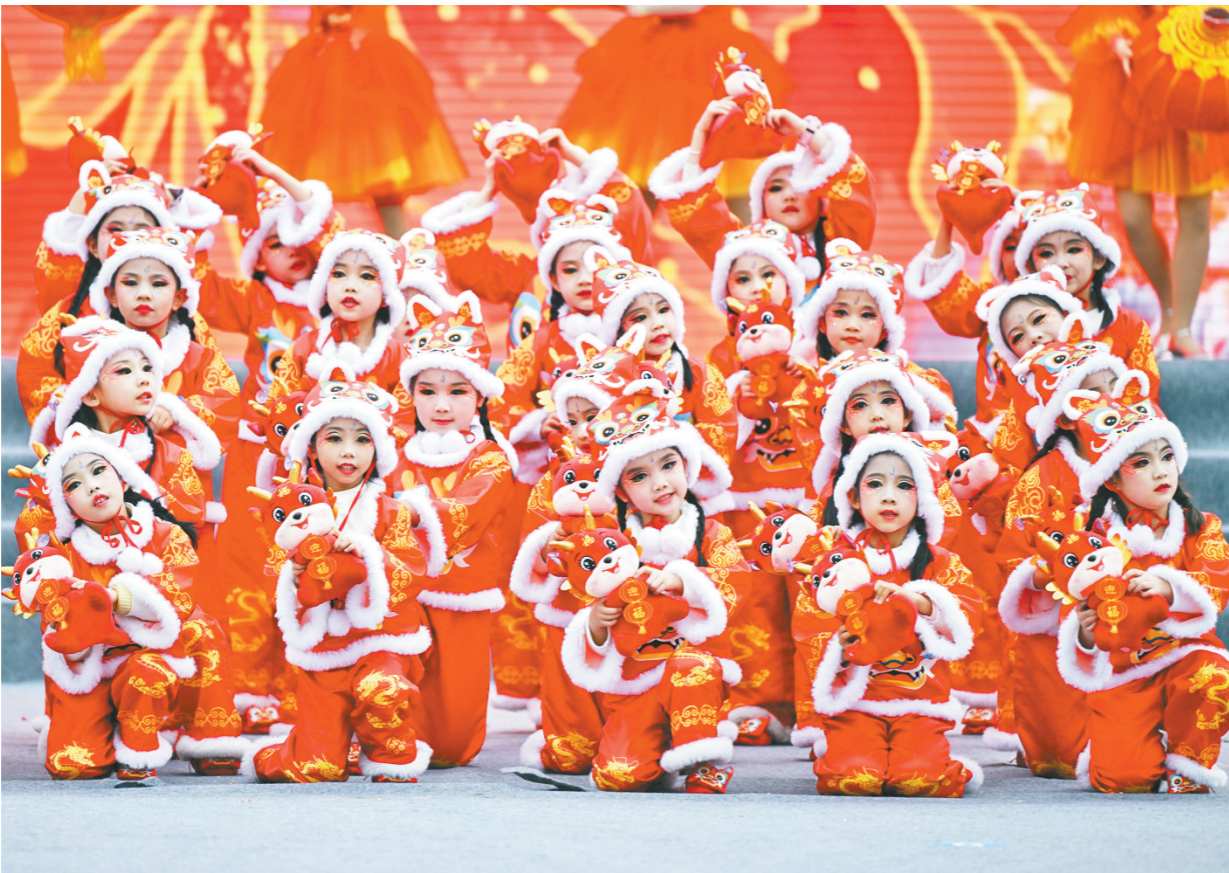
2月2日拍摄的“红色石磨子 忆起过春节”——泸州市2024年“长征之春·红色村晚”活动现场。当日,“红色石磨子 忆起过春节”——泸州市2024年“长征之春·红色村晚”活动在四川省泸州市叙永县叙永镇鱼凫公园举行。 1935年2月3日是农历甲戌年腊月三十(即除夕),中央红军进驻叙永石磨子,并在此停留,在此期间红军与当地群众杀猪过年。近日,四川省泸州市叙永县叙永镇鱼凫社区被确定为2024年全国春节“村晚”示范展示点之一。 新华社记者 刘坤 摄