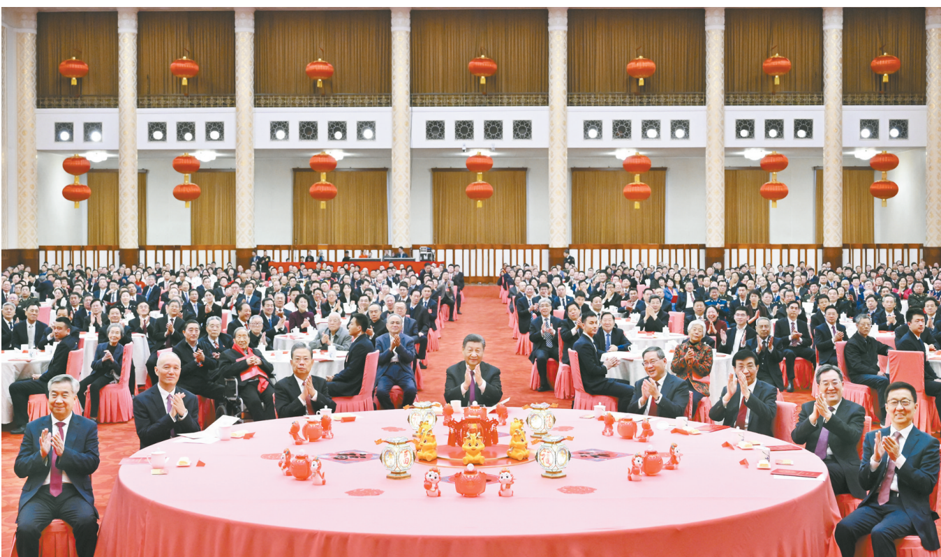
2月8日,中共中央、国务院在北京人民大会堂举行2024年春节团拜会。中共中央总书记、国家主席、中央军委主席习近平发表讲话。