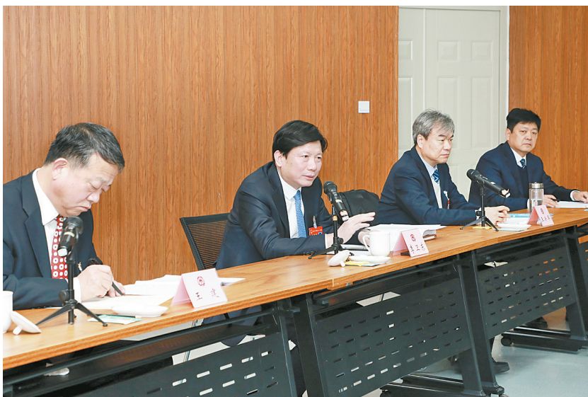
2月21日,市委书记李卫东到市政协十三届二次会议经济一组,和委员们一起讨论政府工作报告及计划、预算报告。

李卫东要求,一要持之以恒兴实业、强主业。围绕我市17条重点产业链,找准定位、聚焦实业、突出优势,扩大产业规模、叫响自身品牌。二要千方百计抓创新、转动能。加大