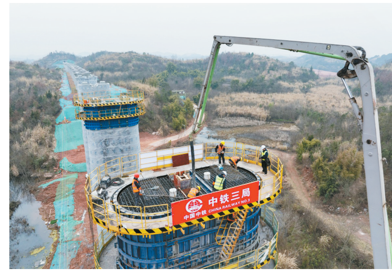
3月4日,中铁三局的施工人员在成渝中线高铁土红湾特大桥建设现场作业(无人照照片)。当日,由中铁三局承建的成渝中线高铁土红湾特大桥下部主体工程全部完工,全路建设有序推进。 成渝中线高铁是我国“八纵八横”高铁网沿江通道的重要组成部分,正线全长292公里,设计时速350公里。