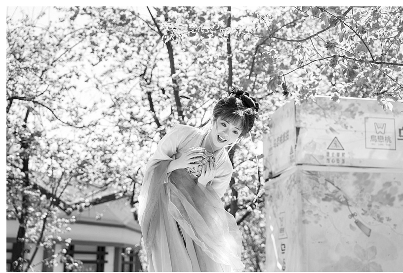
3月24日,一名游客在昆明圆通山公园的樱花树下留影。近日,云南昆明圆通山公园的樱花进入盛花期,吸引了众多市民和游客前来观赏,乐享春日时光。③

新华社天津3月24日电(记者周润健)“天宇剧场”3月25日将推出“水星东大距+半影月食”的“剧目套餐”。届时只要天气晴好,当日傍晚,我国公众有望用肉眼看到平时难得一见的水星。待水星落下后,晚上还能看到一轮满月,这轮满月与2月的年度最小满月相差无几。 人们在地球上只能用肉眼看到金木水火土这五颗行星,其中水星由于距离太阳太近,常常隐匿在太阳的光辉里,难以观测到。只有等到水星与太阳的角距达最大,即“大距”时,才是观测水星的最好时机。 水星大距分为东大距和西大距,东大距是指从地球上,水星在太阳东边,黄昏时可以尝试观测;西大距是指从地球上,水星在太阳西边,黎明时可以尝试观测。不论是东大距还是西大距,看到水星的时间都不会超过2个小时。今年水星共有7次大距,包括3次东大距和4次西大距。“能否看到水星,并不完全取决于大距时水星与太阳的角距,更重要的是日出或日落时的地平高度。本次大距时,水星的地平高度是3次东大距中最高的,接近18度,亮度约-0.2等。届时只要天气晴好,我国感兴趣的公众有望裸眼或是借助小型天文望远镜在西方稍偏北的天空观测到水星。”中国天文学会会员、天文科普专家修立鹏说。 除了水星东大距,25日还将发生一次半影月食,也就是月球时进入地球的半影,不进入本影。半影月食发生时,月球看起来与满月无异,仅亮度降低变得稍暗一些,肉眼不易分辨差异,但以摄影方式则能看出变化。 “本次半影月食发生时正值我国白天,公众无缘一睹‘月亮的脸悄悄改变’,但当晚可以欣赏到一轮满月,这轮满月与2024年2月24日的年度最小满月相差无几,值得一赏。”修立鹏说。