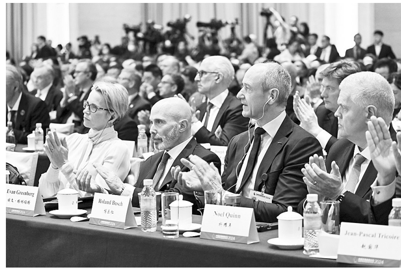
3月24日,与会者在嘉宾发言后鼓掌。当日,中国发展高层论坛2024年年会在北京开幕。本次年会以“持续发展的中国”为主题,由国务院发展研究中心主办。

新华社北京3月24日电(记者李晓明)国防部新闻发言人吴谦24日就菲律宾侵闯仁爱礁答记者问指出,如果菲方一再挑战中方底线,中方将继续采取坚决果敢措施,坚定维护自身的领土主权和海洋权益。 吴谦说,3月23日,菲海军舰船擅闯中国仁爱礁邻近海域,图谋向其非法“坐滩”军舰运送物资的菲方船只采取管制驱离等措施。发言人对此有何评论? 吴谦说,3月23日,菲海军舰船擅闯中国仁爱礁邻近海域,图谋向其非法“坐滩”军舰实施运补。中国海警依法依规对菲方船只实施规制、拦阻、驱离,坚决打掉菲侵权挑衅图谋。此次事件完全是由菲方挑衅滋事引发的,中方处置合理合法、专业规范。 吴谦指出,需要强调的是,中国对包括仁爱礁在内的南沙群岛及其附近海域拥有无可争辩的主权,中方的主权和领土完整不容侵犯。中方愿与菲方通过对话谈判妥善解决争议,但菲方出尔反尔、背信弃义,妄图将仁爱礁非法“坐滩”军舰加固建成永久性设施,中方对此绝不会坐视不管。我们正告菲方,停止发表任何可能导致矛盾激化、局势升级的言论,停止一切侵权挑衅行径。如果菲方一再挑战中方底线,中方将继续采取坚决果敢措施,坚定维护自身的领土主权和海洋权益。