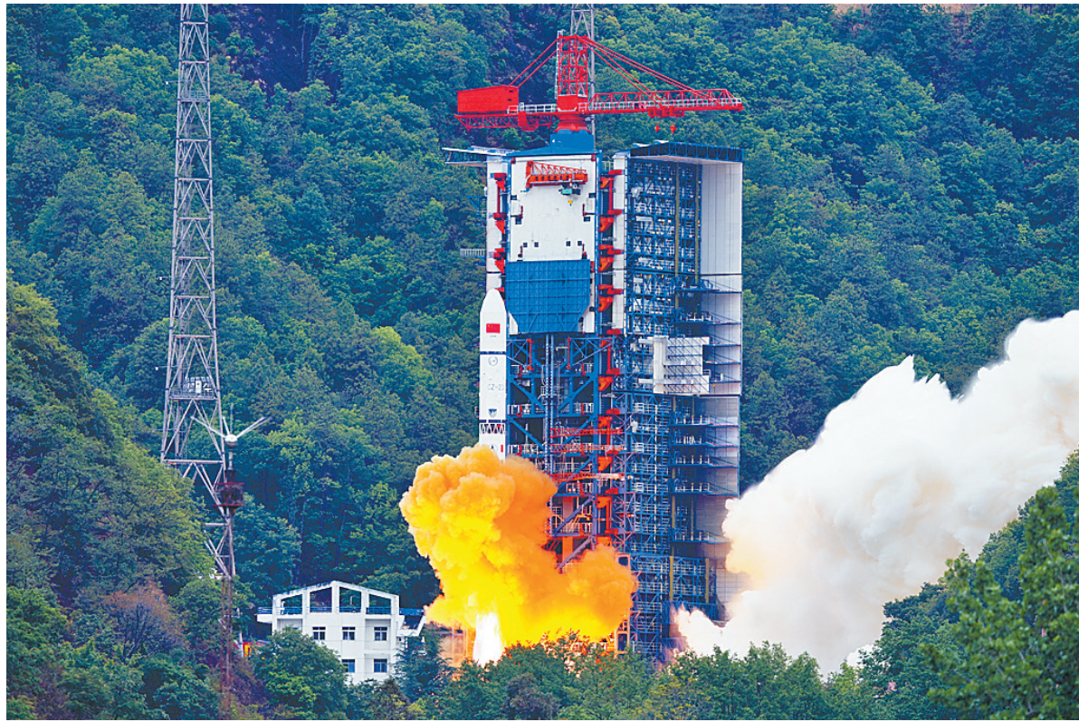
4月21日7时45分,我国在西昌卫星发射中心使用长征二号丁运载火箭,成功将遥感四十二号02星发射升空,卫星顺利进入预定轨道,发射任务获得圆满成功。