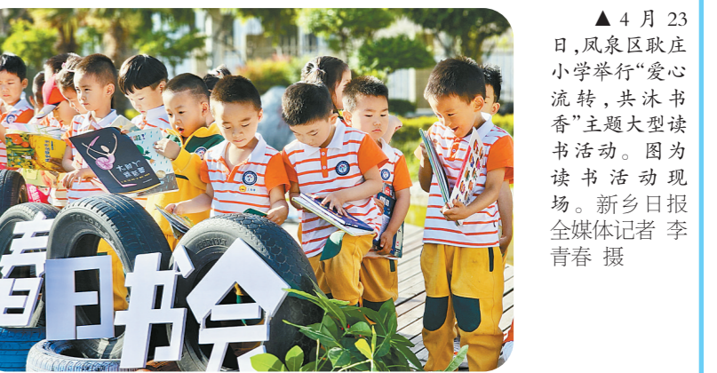
▲4月23日,凤泉区耿庄小学举行“爱心流转,共沐书香”主题大型读书活动。图为读书活动现场。