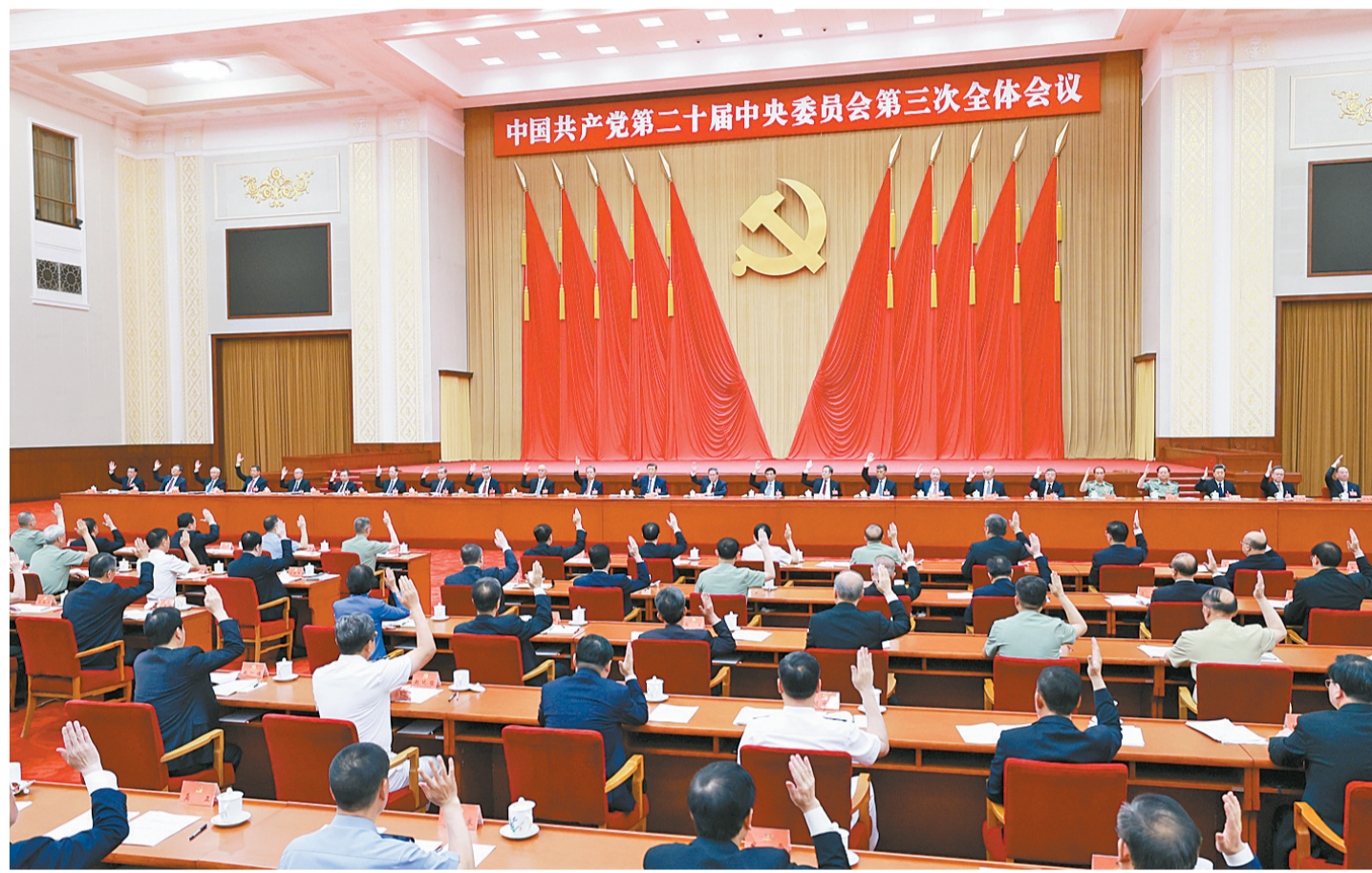
中国共产党第二十届中央委员会第三次全体会议,于2024年7月15日至18日在北京举行。中央政治局主持会议。

新华社北京7月18日电 中国共产党第二十届中央委员会第三次全体会议公报(2024年7月18日中国共产党第二十届中央委员会第三次全体会议通过) 中国共产党第二十届中央委员会第三次全体会议,于2024年7月15日至18日在北京举行。出席这次全会的有,中央委员199人,候补中央委员165人。中央纪律检查委员会常务委员会委员和有关方面负责同志列席会议。党的二十大