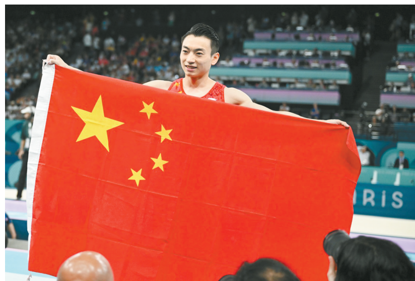
8月5日,中国选手邵敬国庆祝夺冠。当日,在巴黎奥运会体操男子双杠决赛中,中国选手邵敬国获得冠军。