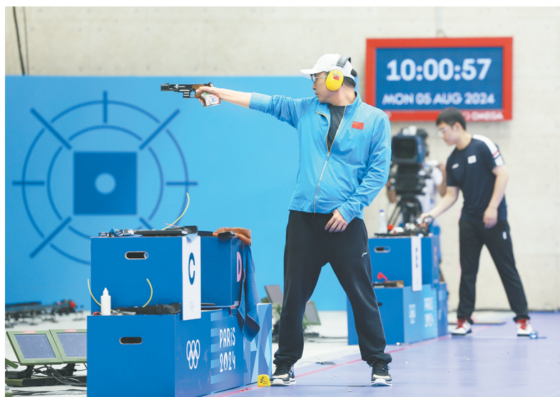
8月5日,中国选手李强宏在比赛中。当日,在巴黎奥运会射击男子25米手枪速射决赛中,中国选手李强宏夺得冠军。