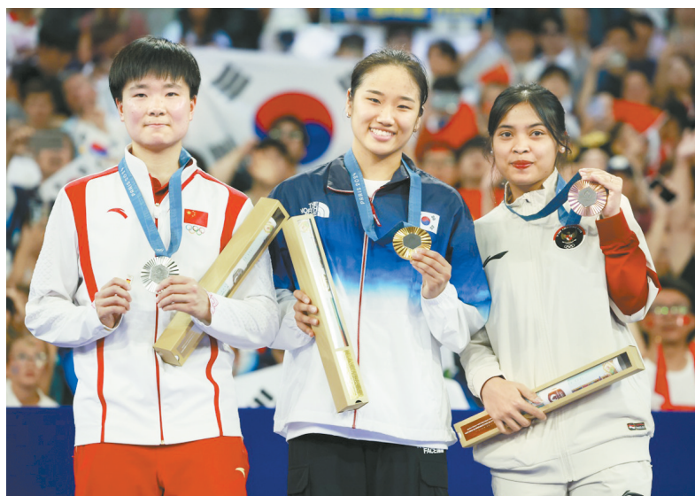
8月5日,在巴黎奥运会羽毛球项目女单决赛中,韩国选手安洗莹获得金牌,中国选手何冰娇获得银牌。印度尼西亚选手玛丽斯卡获得铜牌。