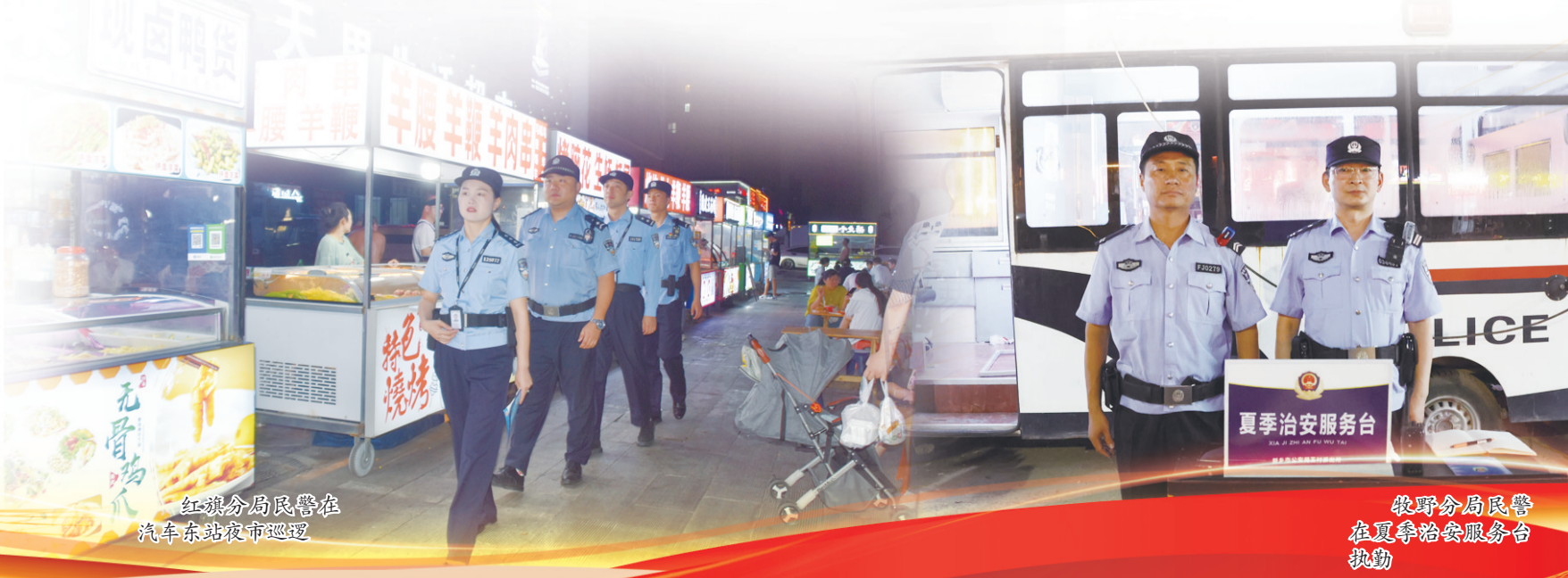
红旗分局民警在汽车东站夜市巡逻

此外,市公安局固化周讲评工作机制,围绕各级公安机关发案破案、挂牌整治推进、治安乱点整治等工作进行讲评通报,同时,加强对各级公安机关监督检查力度,实时跟踪问效,推动专项行动落地见效。夏季治安打击整治行动开展以来,已刊发全市公安机关夏季治安打击整治专报24期,开展讲评通报10次、一线督导3次。