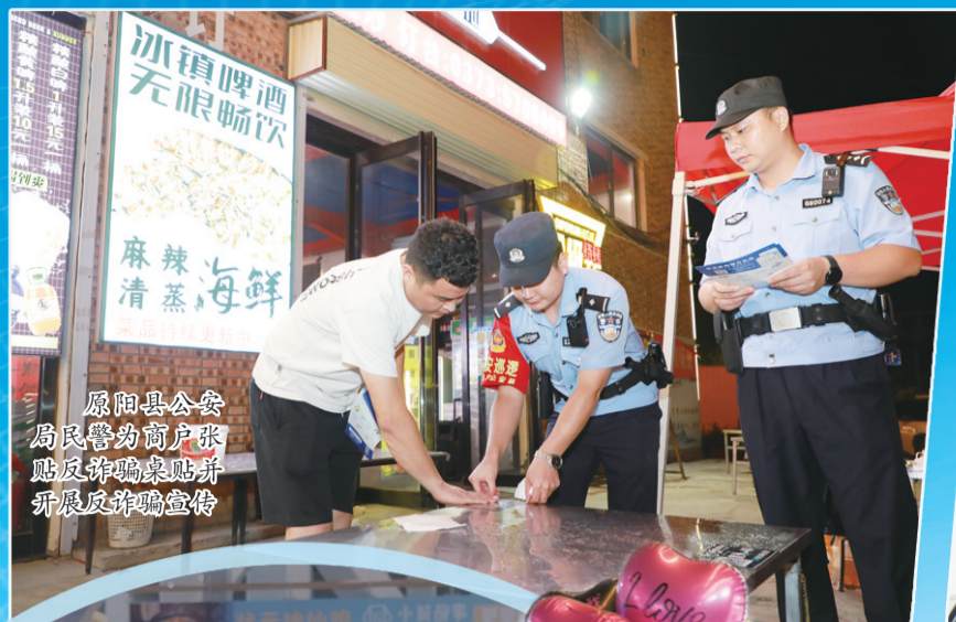
原阳县公安局民警为商户张贴反诈标识并开展反诈宣传