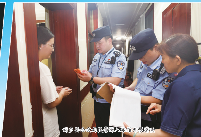
新乡县公安局民警深入旅馆开展清查