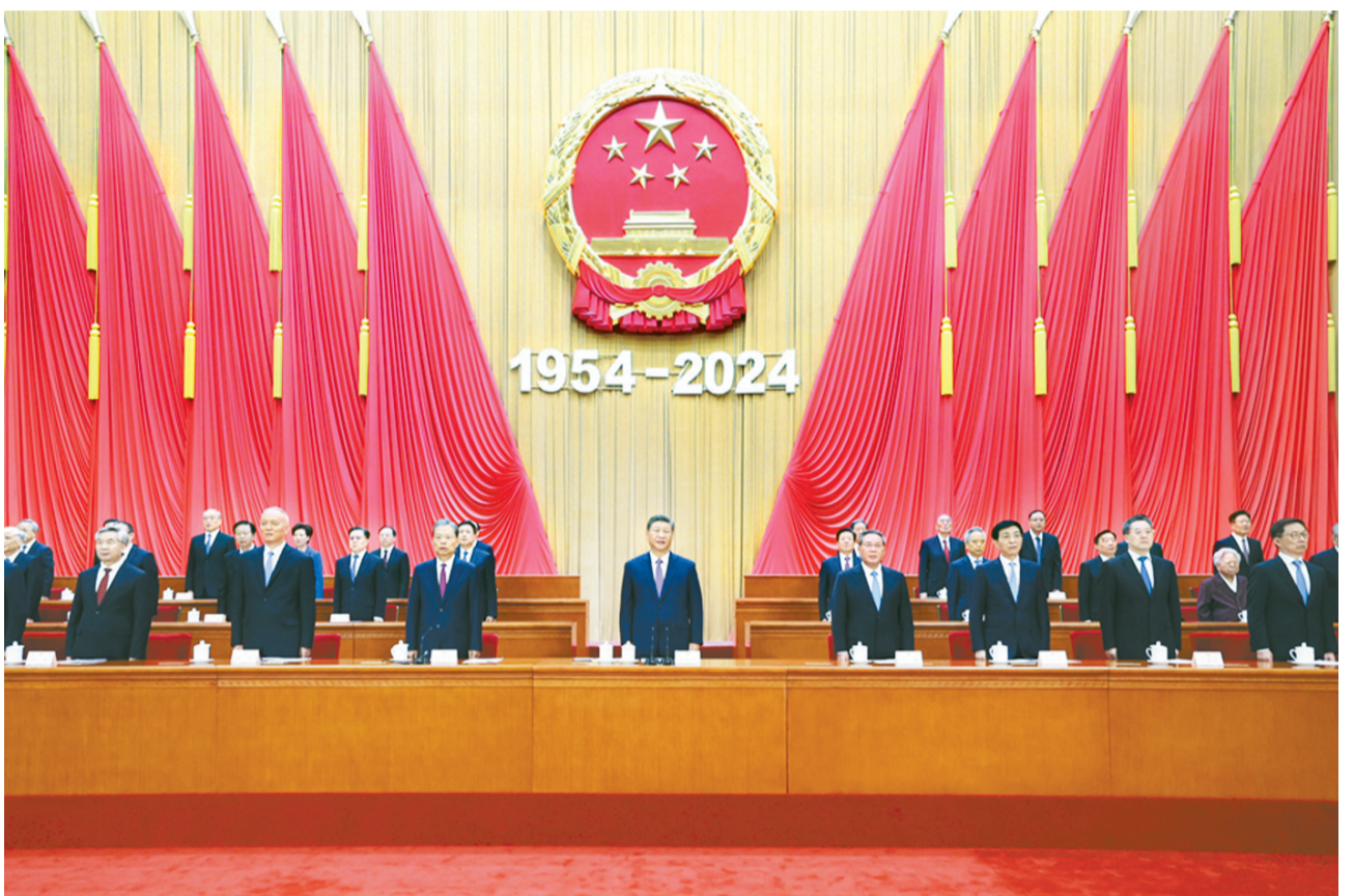
9月14日上午，中共中央、全国人大常委会在北京人民大会堂隆重举行庆祝全国人民代表大会成立70周年大会。习近平、李强、赵乐际、王沪宁、蔡奇、丁薛祥、李希、韩正等出席大会。

人民代表大会制度是中国共产党领导中国人民艰辛探索长期奋斗的成果，是从中国土壤中生长起来的全新政治制度，是人类政治制度史上的伟大创造。实践证明，人民代表大会制度是符合我国国情和实际、体现社会主义国家性质的好制度，是能够有效凝聚全体人民力量一道推进中国式现代化的好制度。