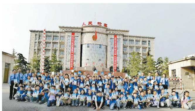
(本版图片均为资料图片)