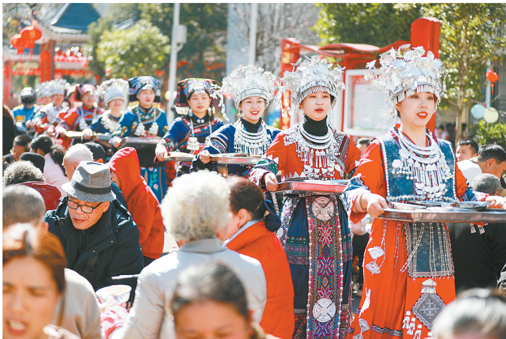
1月12日,穿着民族服饰的工作人员为参与活动的群众上菜。当日,贵州省黔南布依族苗族自治州都匀市小团寨街道思源社区群众欢聚一堂,一起跳竹竿舞、芦笙舞,观看舞龙、舞狮表演,参与打糍粑、趣味游戏等活动,一起吃团圆宴,共迎幸福年。