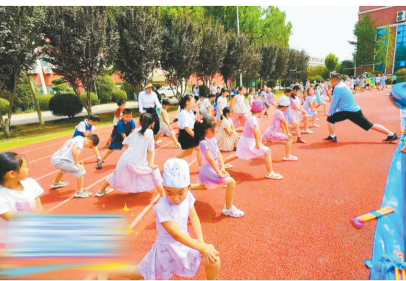
图为“爱心托管班”老师在为孩子们辅导游泳课