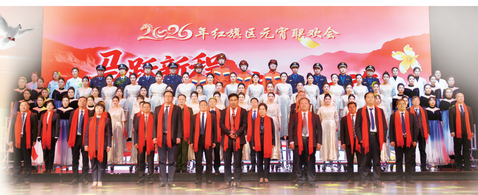
2026年红旗区元宵联欢会

会议结束后,“马跃新程、幸福红旗”元宵联欢会精彩纷呈上演,欢天喜地闹元宵,浓墨重彩绘华章,策马扬鞭启新程三个篇章有序推进,用悠扬旋律奏响了新时代的奋进之歌,激励“红旗人”在奋力谱写中原大地推进中国式现代化新篇章中展现更大担当。