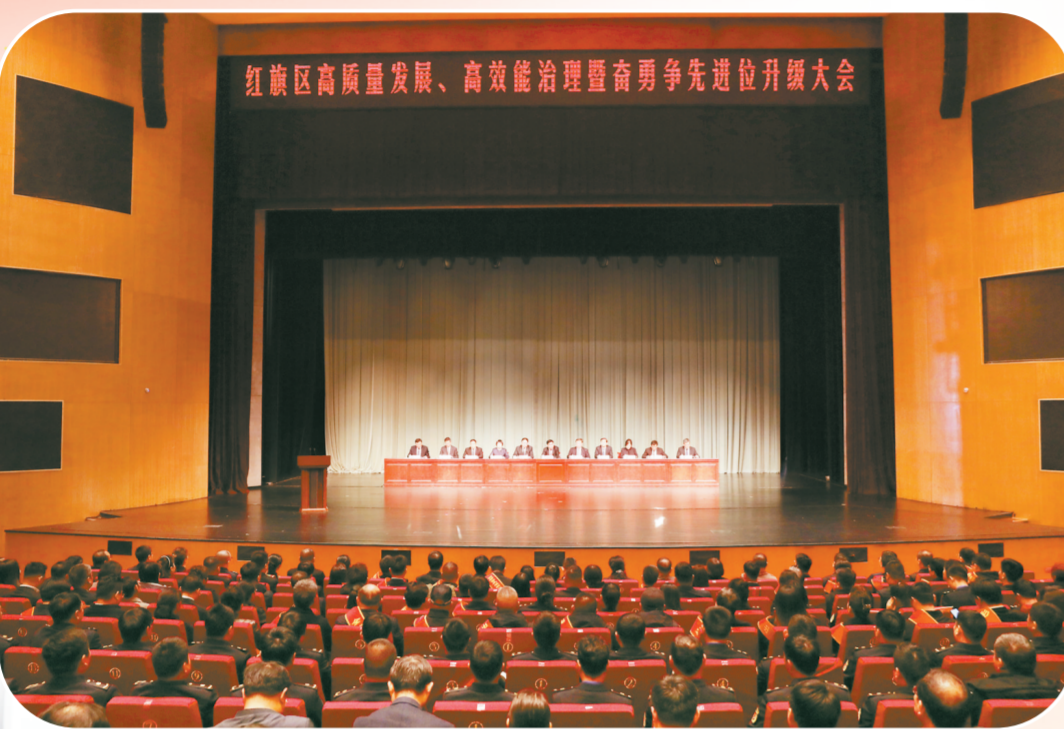
红旗区高质量发展、高效能治理暨营商环境争先创优升级大会