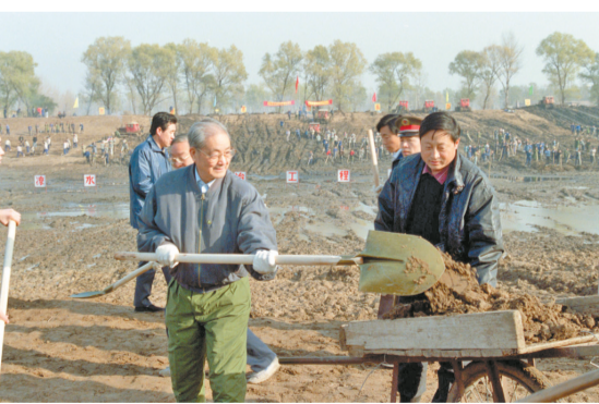
1991年11月13日,宋平同志(左)来到北京市通州区张家湾凉水河整治工程工地参加劳动。

中国共产党的优秀党员,久经考验的忠诚的共产主义战士,杰出的无产阶级革命家、政治家,党和国家的卓越领导人,中国共产党第十三届中央政治局常委,原国务委员宋平同志,因病医治无效,于2026年3月4日15时36分在北京逝世,享年109岁。