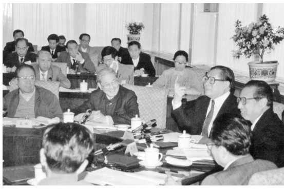
1991年4月,江泽民同志、宋平同志(前排左二)等与参加党建理论讨论会的代表座谈。