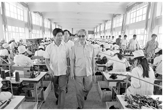
1990年8月14日,宋平同志(右)在山东省威海市文登区考察。