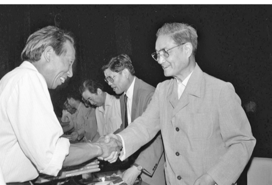
1991年6月26日,中共中央组织部、中共中央宣传部等单位在北京召开大会,表彰全国高校优秀思想政治工作者。这是宋平同志(右)向获奖的个人颁奖。