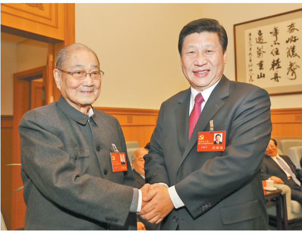
2012年11月14日,在党的十八大闭幕前,习近平同志同宋平同志在一起。