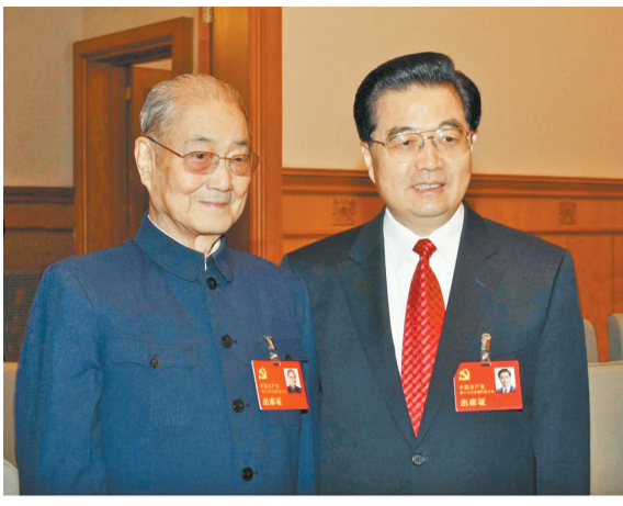
2007年10月21日,在党的十七大闭幕前,胡锦涛同志同宋平同志在一起。