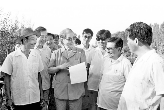
1990年7月中下旬,宋平同志(前左二)来到内蒙古自治区巴彦淖尔市临河区马场地村了解基层党支部建设情况。