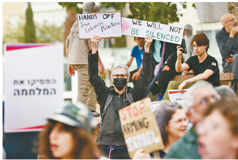
3月14日,人们在以色列特拉维夫参加集会。当日,人们在特拉维夫一处广场举行集会,抗议美国和以色列军事打击伊朗,要求美以停止一切战争行为。

新华社耶路撒冷/贝鲁特3月14日电(记者 冯国茵 中峰)以色列国防军14日威胁空袭黎巴嫩救护车和医疗设施,声称黎巴嫩真主党正“广泛将救护车和医疗设施用作军事用途”。真主党和黎巴嫩政府均否认这一说法。 以军阿拉伯语发言人阿维凯·阿德拉伊在社交媒体发文称,以军已发出警告,黎巴嫩真主党利用救护车和医疗设施从事军事活动的行为必须立即停止,否则以色列将对此“采取行动”。 然而,这名发言人并没有出示关于这一说法的任何证据。