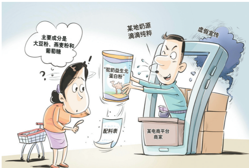
“乱象” 新华社发 王鹏 作