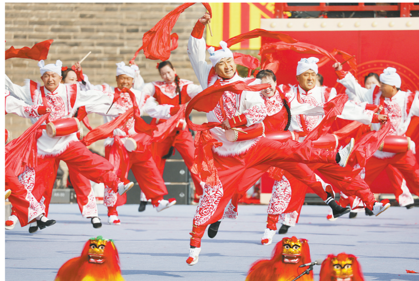
3月15日,演员在河北省石家庄市正定古城进行“安塞腰鼓”表演。3月15日,2026全国鼓王大会在河北省石家庄市正定古城举办,来自北京、天津、山西、陕西、福建、吉林、河南、河北等地的14支鼓乐队以鼓为媒、以乐会友,为观众呈现一场精彩的鼓乐文化盛宴。

新华社北京3月14日电(记者叶昊鸣 樊曦)记者14日从交通运输部获悉,春运40天(2026年2月2日至3月13日),全社会跨区域人员流动量为94.1亿人次,比2025年春运增长4.3%,创历史新高。 具体来看,公路人员流动量为87.4亿人次,同比增长4.2%。其中,自驾出行量为74.6亿人次,占全社会跨区域人员流动量的79.3%;公路营业性客运量为12.8亿人次。铁路旅客发送量为5.4亿人次,同比增长4.8%。水路旅客发送量为3597万人次,同比增长15.3%。民航旅客发送量为9439万人次,同比增长4.6%。