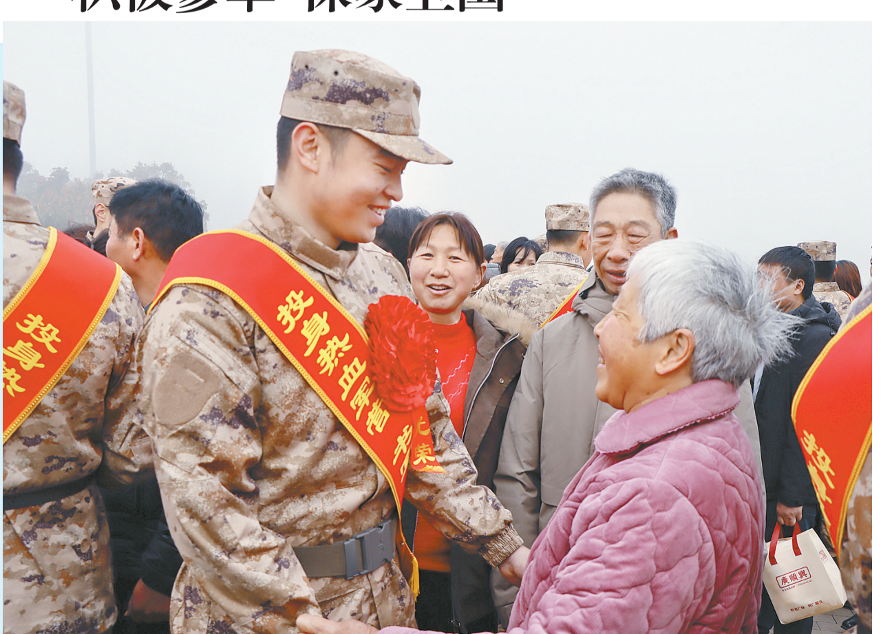
3月17日,卫辉市举行2026年上半年新兵欢送大会。65名优秀青年胸戴红花、肩披绶带,精神昂扬、意气风发,即将告别家乡奔赴军营,踏上保家卫国、建功军营的光荣征程。