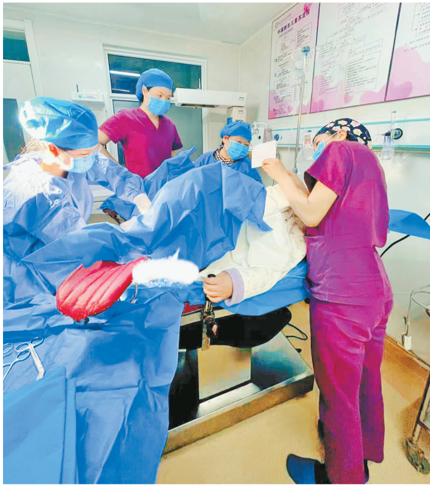
市妇幼保健院 为妇女儿童健康护航

在市妇幼保健院的产房里,无数新生命的啼哭曾在这里响起,但3月的一天,一场没有语言的“对话”,却让这里的医护人员和家属都红了眼眶——一名聋哑产妇,在医护团队全程的纸笔沟通与温柔守护下,顺利迎来了自己的女儿。