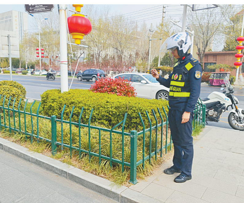
“随手拍”让问题无处遁形

“随手扶”,让秩序蔚然成风。面对歪倒的共享单车、占压盲道的电动自行车,工作人员主动扶起归位,规范摆放;对倾斜的交通标识、公益广告牌,力所能及予以加固。一次次俯身、