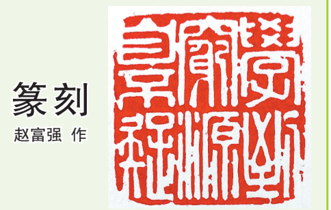
篆刻 赵富强 作