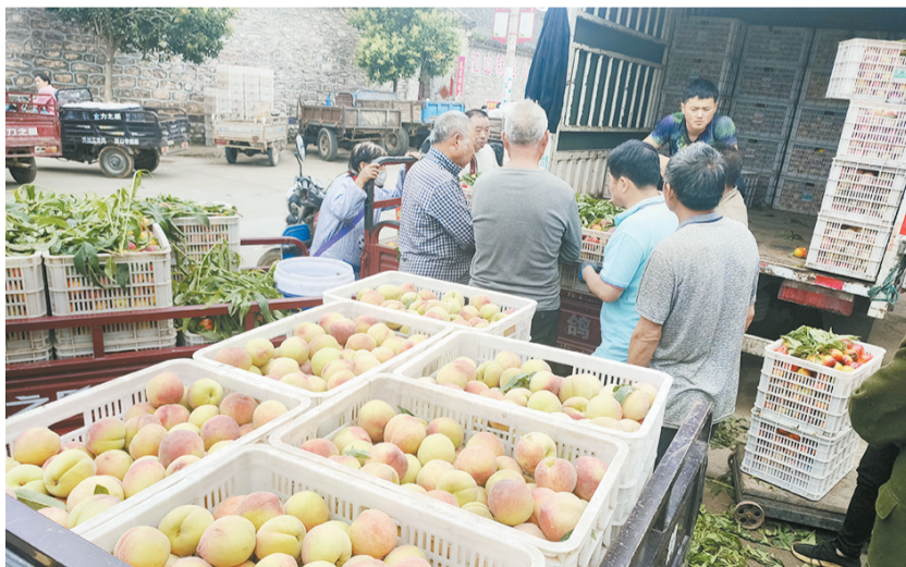
商户上门收购,解决群众销售难题

带领下,以争创“五星”支部为契机,创新探索“党建+基金会+合作社+农户”发展模式,成立辉县市杨和寺绿珍果业合作社,引入中国乡村发展基金会扶持资金,创建“豫新仙桃”品牌,打造“桃花源”旅游街,发展“旅游+林果业”,进行产业升级,助农增收致富。