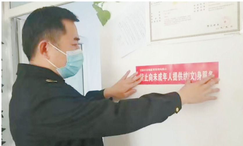
正在店内张贴“禁止向未成年人提供纹(文)身服务”提示语