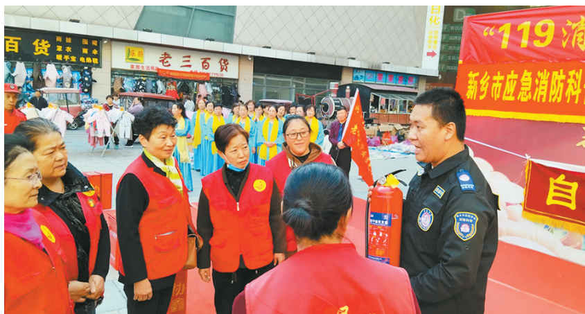
消防专业人员向群众讲解灭火器材的用法

在活动现场,消防专业人员也亲临现场,与观众互动交流,分享了他们的消防安全知识和技能,让观众们受益匪浅。