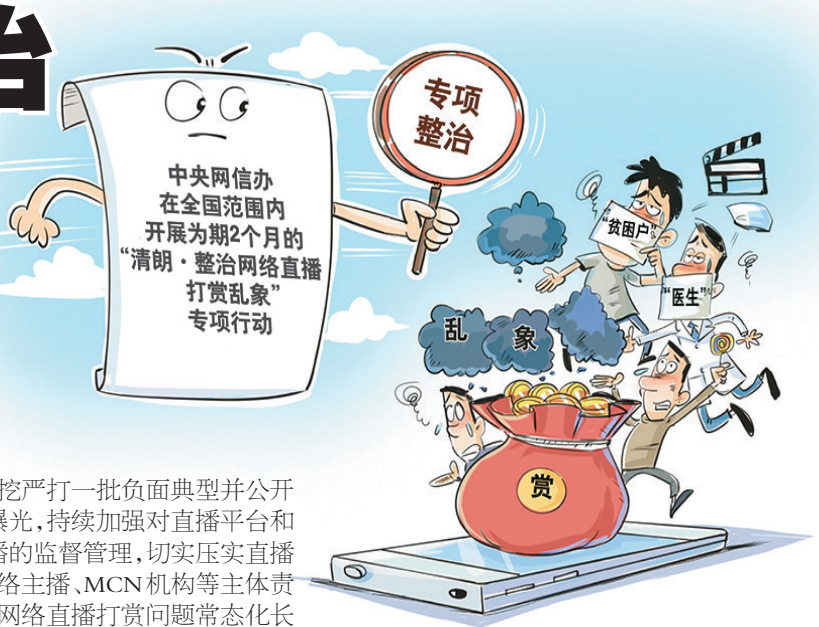
专项整治 新华社发 王鹏 作

重点,深挖严打一批负面典型并公开向社会曝光,持续加强对直播平台和网络主播的监督管理,切实压实直播平台、网络主播、MCN机构等主体责任,提升网络直播打赏问题常态化长效化治理水平。